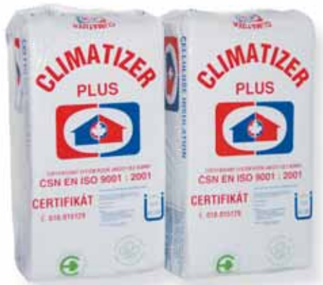
Vrečia s expedične baleným materiálom CLIMATIZER PLUS.

Celá výroba sa zabezpečuje suchou cestou. V súčasnosti je materiál bežne dostupný v Česku, v Poľsku, Nemecku, Rakúsku, vo Švajčiarsku a od roku 1990 i na Slovensku prostredníctvom firmy VUNO HREUS zo Žiliny. Konečný výrobok je vláknitý, balený do polyetylénových vriec a je určený na spracovanie v špecializovaných certifikovaných stavebných fir-