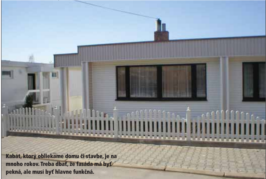
Kabát, ktorý obliekame domu či stavbe, je na mnoho rokov. Treba dbať, že fasáda má byť pekná, ale musí byť hlavne funkčná.

Tepelná izolácia CLIMATIZER PLUS je priamo v výrobce obohatená prísadami, ktoré výrazne spomaľujú